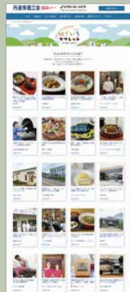
▲丹波市商工会サイト取材執筆