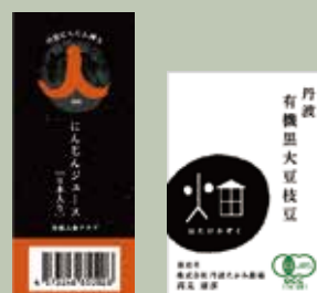
▲パッケージデザイン